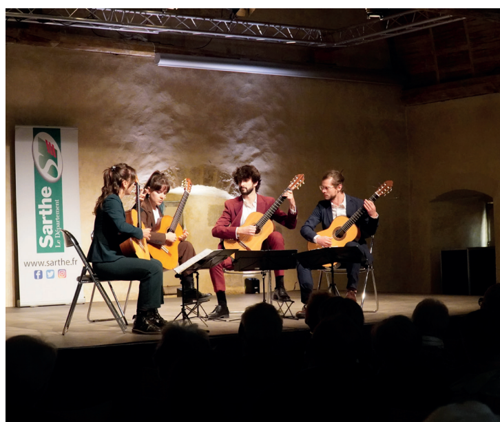
Quatuor Neptunium | Concerts de l'Épau 2024