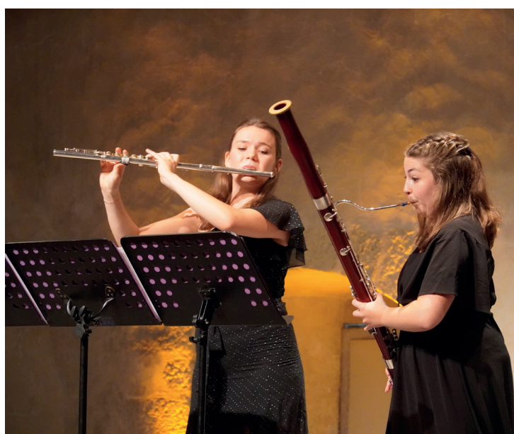
Duo Vilahos | Concerts de l'Épau 2024

6 - Rémunération : Cette programmation estivale s'envisage comme une première étape vers la professionnalisation : la prestation artistique du concert fera l'objet d'un contrat d'engagement et d'une rémunération de 200 € brut par musicien ainsi que de la prise en charge des frais de déplacement ( en France métropolitaine ) et d'hébergement.