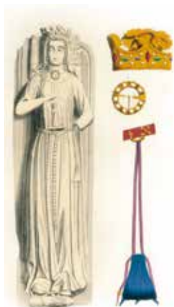
Gravure extraite de l'ouvrage de Charles Albert Stothard, The Monumental Effigies , 1817 (Archives départementales de la Sarthe, bibliothèque)

Le Département de la Sarthe poursuit, à travers son programme d'animations culturelles de l'Abbaye Royale de l'Épau, son cycle d'expositions de fin d'année intégré au parcours lumineux et sonore. Il renoue cette année avec l'univers de la bande dessinée, à l'occasion de la parution d'un album consacré à Bérengère de Navarre édité en partenariat avec les Editions Petit à Petit . Dans une scénographie immersive, s'appuyant sur les planches du dessinateur Bruno Rocco, l'exposition traversera les épisodes charnières de ce personnage historique emblématique de l'histoire du site et permettra d'apporter un éclairage plus général sur le contexte culturel et social dans lequel ils s'inscrivent. Elle évoquera également les coulisses de la conception d'une BD en revenant sur les étapes de sa création, des dessins préparatoires aux planches colorisées et mises en texte, pour accompagner les actions de médiation scolaires proposées autour de l'exposition.