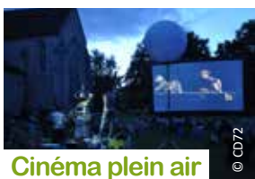
Cinéma plein air

Collectif Pourquoi pas - Un piano et quatre artistes de cirque. À la base les portés acrobatiques. Ça jongle aussi : avec les notes, avec les balles, avec les mots et les surprises.