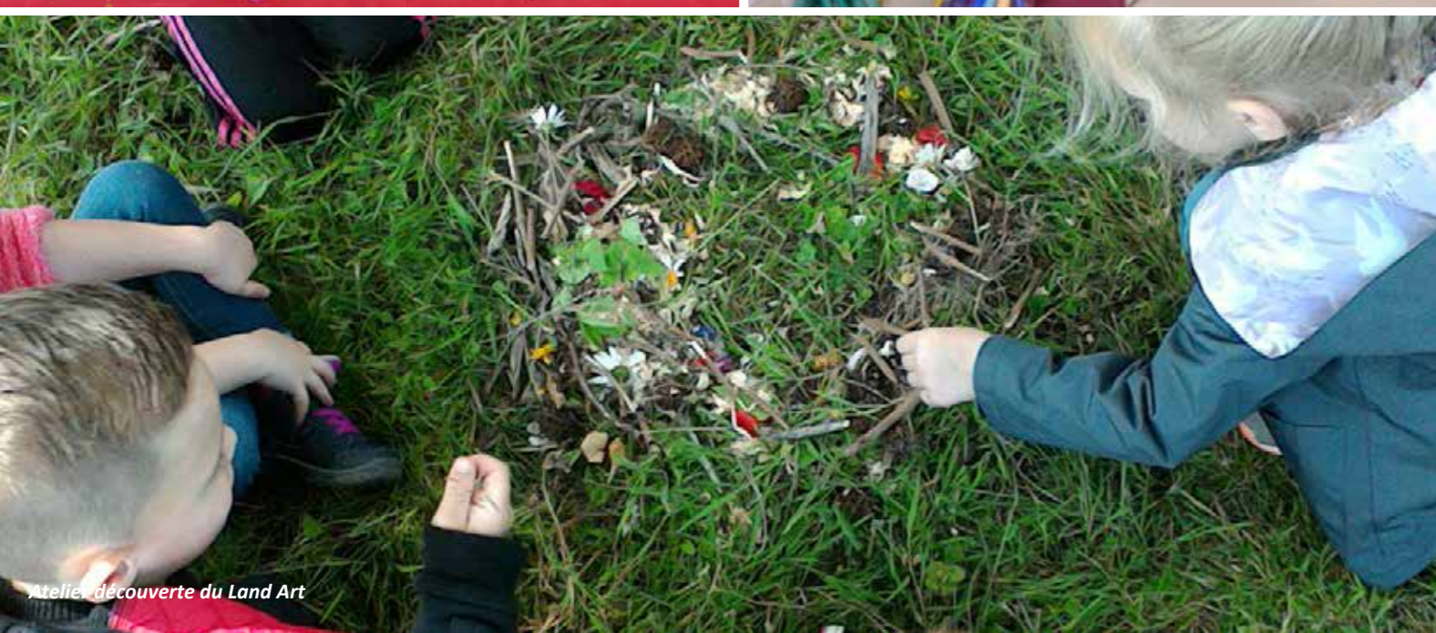
Atelier découverte du Land Art