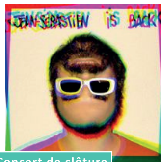
Concert de clôture

Des ateliers seront proposés toute la journée pour découvrir le principe de la caméra obscura. Vivez l'expérience de cette drôle de machine !