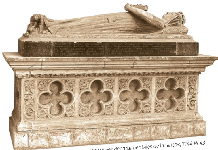
© Archives départementales de la Sarthe, 1344 W 43

Au XIX e siècle, le gisant était positionné contre un mur de la Cathédrale Saint-Julien du Mans. Les 3 côtés ont été conservés. Un 4 e sera recréé.