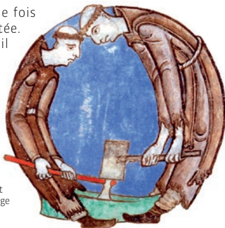
Lettrine Q représentant des moines défrichant

La zone située dans la clôture, une fois aménagée et défrichée, est exploitée. Pour vivre de manière autonome il faut cultiver différents espaces. Généralement, le jardin médiéval est constitué d'un verger, d'un potager et d'un jardin des simples.