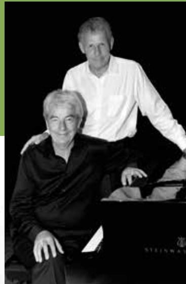
Jean-Philippe Collard et Patrick Poivre d'Arvor