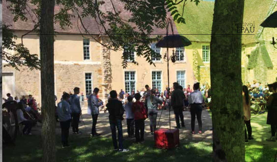
Scène ouverte