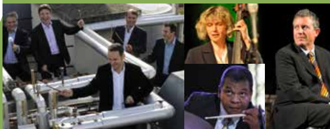
adONF © DR