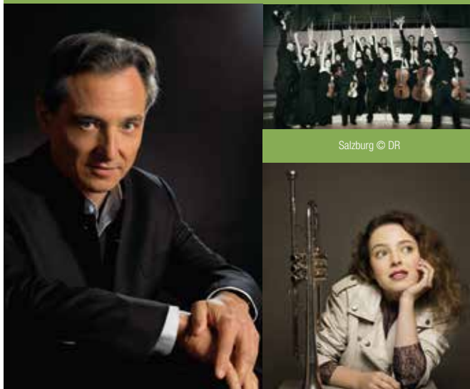
Michel Dalberto