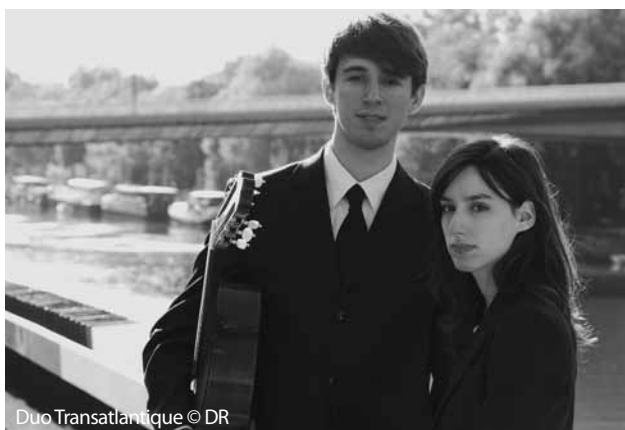
Duo Transatlantique