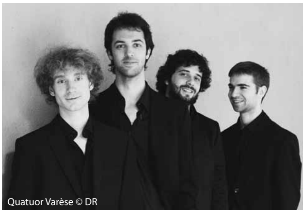
Quatuor Varèse