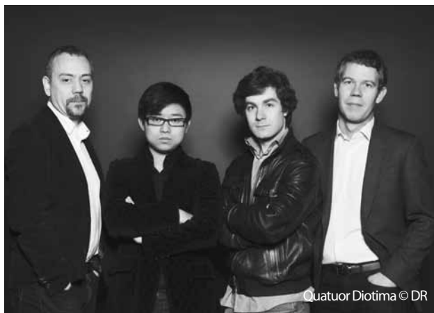
Quatuor Diotima