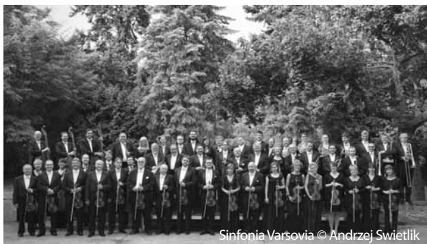
Sinfonia Varsovia