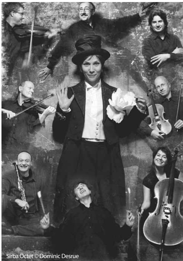
Sirba Octet