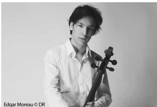
Edgar Moreau