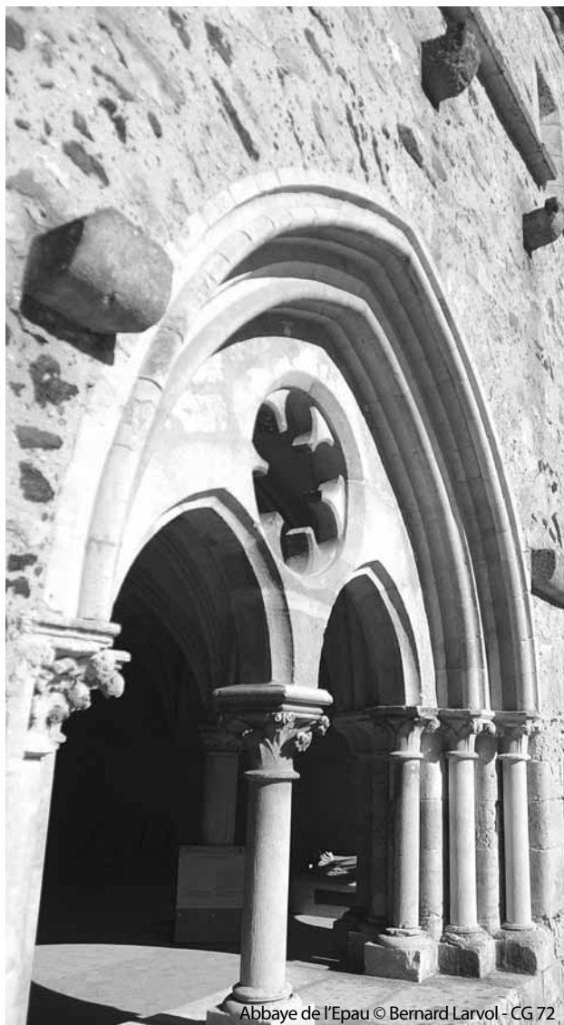
Abbaye de l'Epau

Cinéma en plein air, expositions, rencontres avec les artistes, concerts-apéritifs... et même un défilé de mode !!! Tout ça dans un esprit champêtre (pique-nique, dégustation de vins par les producteurs locaux).