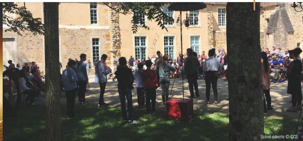
Scène ouverte