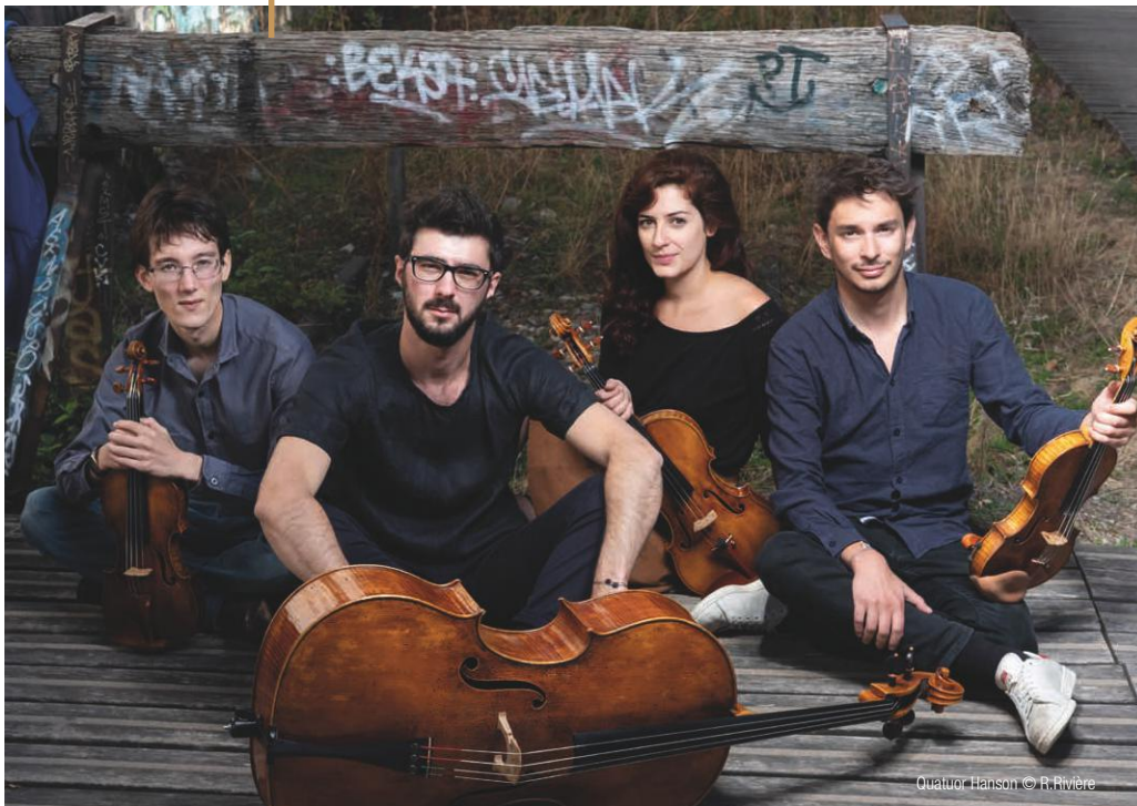
Quatuor Hanson

🕒 12h30 | Hôtel du Département – Salle Caillaux