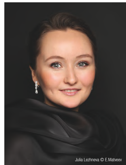
Julia Lezhneva