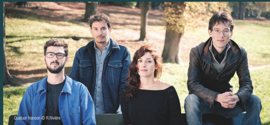
Quatuor Hanson

Travail autour d'œuvres programmées au festival par courtes séquences : jouer, analyser, arranger/réorchestrer.