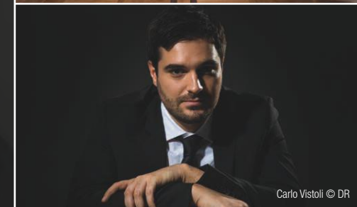
Carlo Vistoli