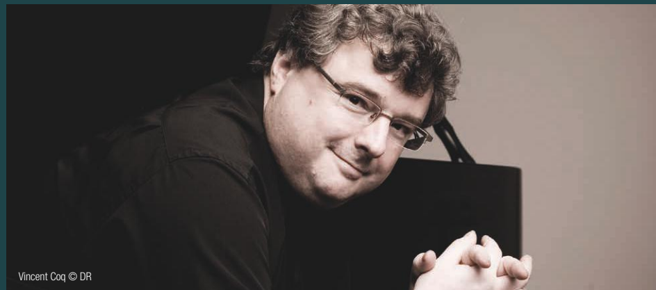
Vincent Coq © DR

Depuis plusieurs années, le festival de l'Épau ouvre une fenêtre sur les pratiques amateurs. Cette fenêtre est notamment le reflet du travail d'accompagnement de l'enseignement artistique, aménagé dans le Schéma départemental, que le Conseil départemental mène en collaboration avec les établissements d'enseignement artistique et les structures culturelles du territoire. L'enjeu du Schéma est de garantir un parcours d'apprentissage et d'éducation, depuis l'éveil jusqu'aux portes de la professionnalisation, pour ceux et celles qui le souhaitent, accessible à tous les habitants de la Sarthe.