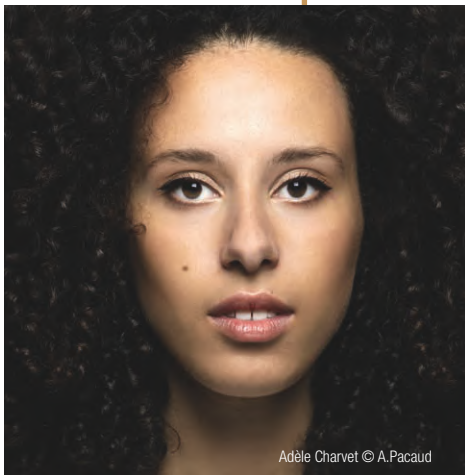
Adèle Charvet