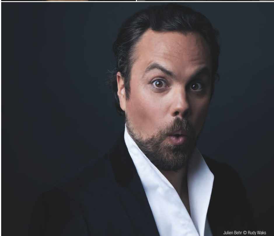
Julien Behr