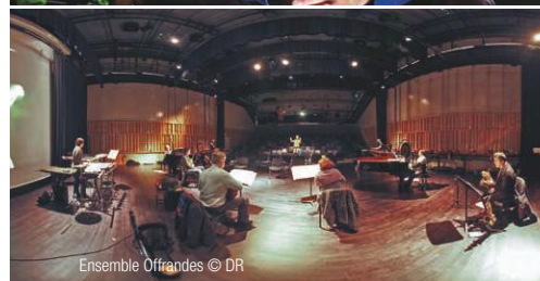
Ensemble Offrandes

6 musiciens disséminés dans le dortoir, certains déambulant, jouant en écho au programme Ravel du concert qui précède et en adéquation avec l'énergie douce imaginée par l'Ensemble Offrandes.