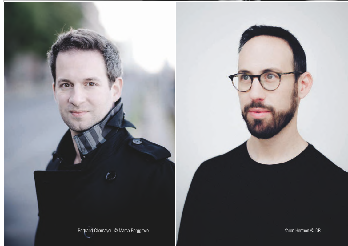
Bertrand Chamayou