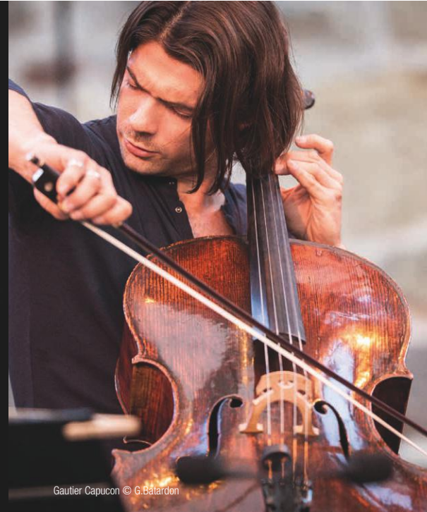
Gautier Capuçon