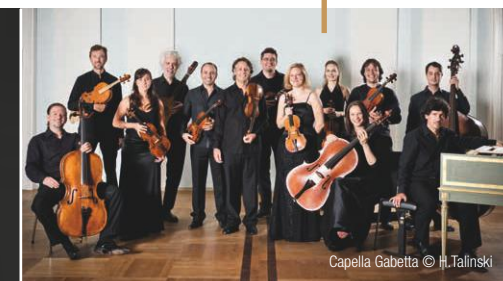
Capella Gabetta