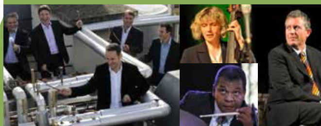
adONF © DR