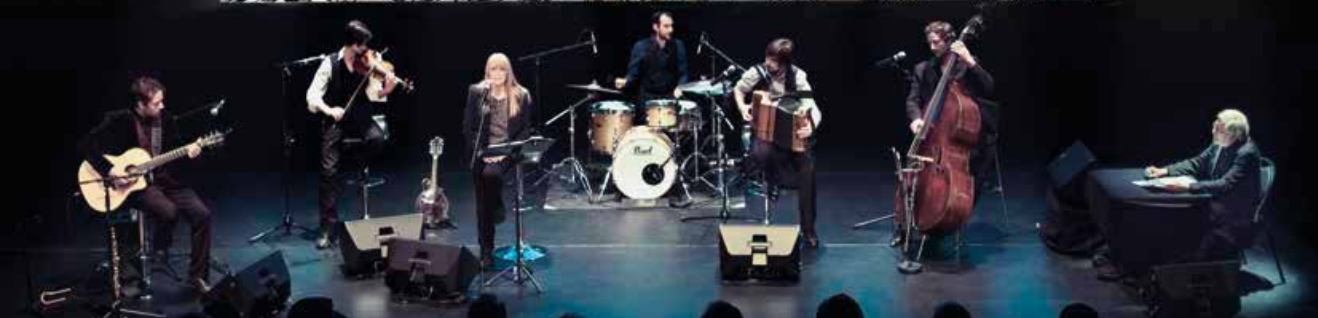
Spectacle Putain de Guerre.