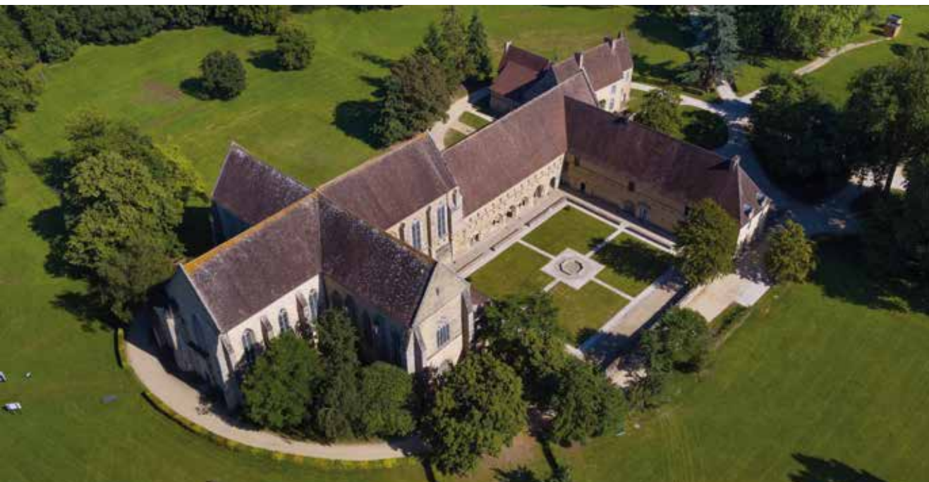
Vue aérienne Abbaye de l'Epau.

Dernièrement, les recherches du Père Michel Niaussat , moine cistercien écrivain, mettent en lumière le caractère royal de l'édifice. L'abbaye de l'Epau devient alors Abbaye Royale de l'Epau en mars 2017.