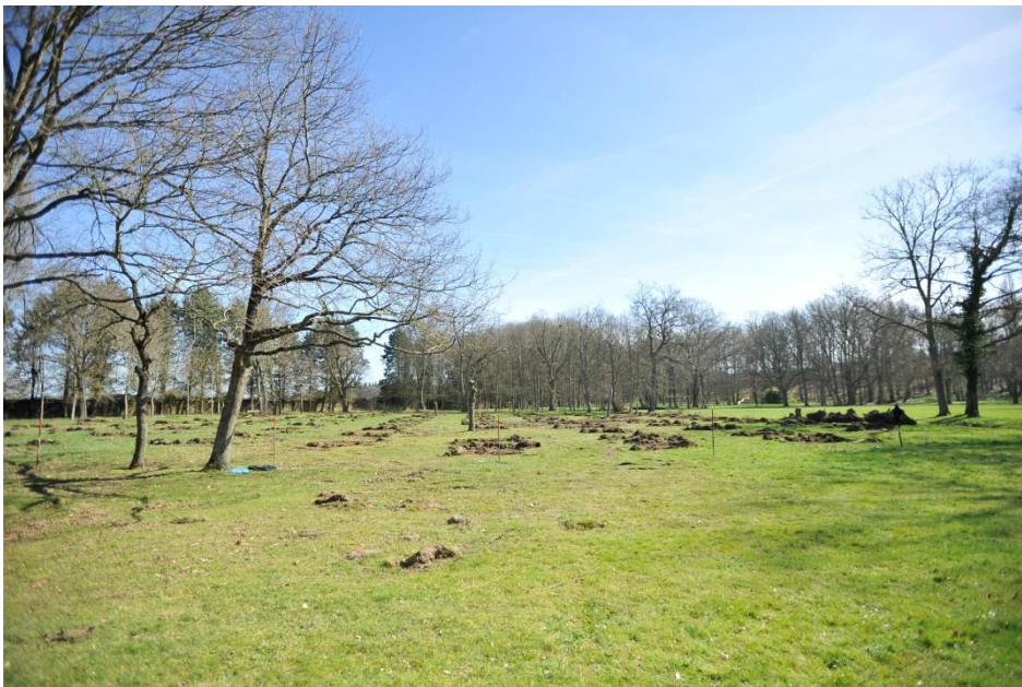
Aménagement du verger – parc de l'Abbaye, mars 2017

Les expositions photographiques, depuis l'an dernier déborde du cadre de l'Epau et sont accrochées sur les grilles de l'Hôtel du Département (les musiciens décalés de Nikolaj Lund) et même, pour la première fois à la gare SNCF du Mans lors des 24H (Denis Lambert et Hervé Petitbon).