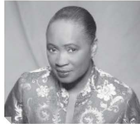
Barbara Hendricks