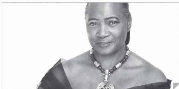
Barbara Hendricks