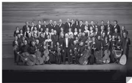
Les Arts Florissants

Dès la première écoute de ses mélodies, on se trouve transporté dans un univers coloré subtilement teinté de jazz. Quelques notes suffisent à nous transporter au Brésil.