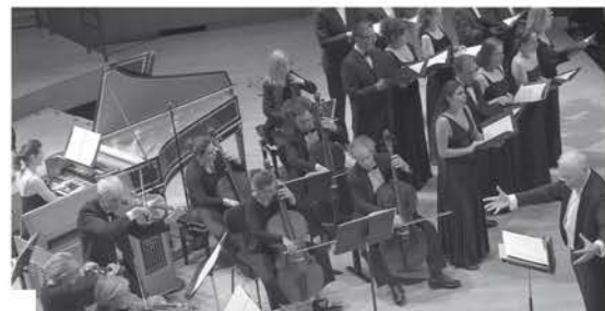
Les Arts Florissants