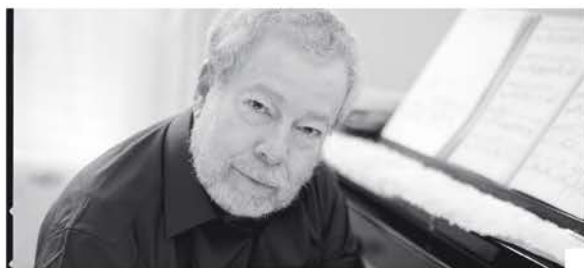
Nelson Freire

Place au classique (et j'aime bien...) et à la richesse infinie de la sonorité des cordes ! Pour nous mener sur ce chemin pavé de chefs d'oeuvre, un musicien incomparable, Augustin Dumay : violoniste dans la grande tradition repéré par Herbert von Karajan, Dumay a mené parallèlement à sa trajectoire de star du violon une carrière de chef d'orchestre. Les solistes sur scène sont eux aussi des maîtres hors pair à l'apogée de leur art : le violoncelliste Henri Demarquette dans Haydn ou l'altiste Miguel Da Silva dans Mozart, que des promesses de bonheur. Et puisque les cordes sont reines, deux oeuvres à l'expression puissante pour orchestre à cordes concluront la soirée sur une note intense. Décidément, le classique, j'aime bien.