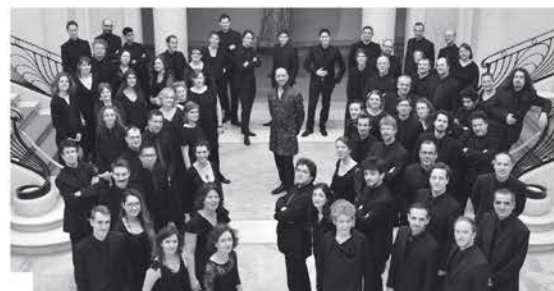
Le Concert Spirituel