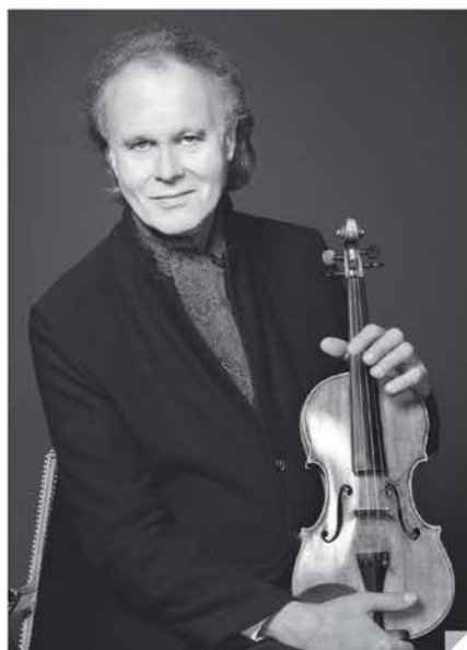
Augustin Dumay

Alain Duault, passionné d'art lyrique propose un florilège des plus beaux airs d'opéras. Les amoureux des voix seront comblés par un plateau où vont briller des chanteuses et chanteurs parmi les plus sollicités du moment et où ils feront aussi de magnifiques découvertes.