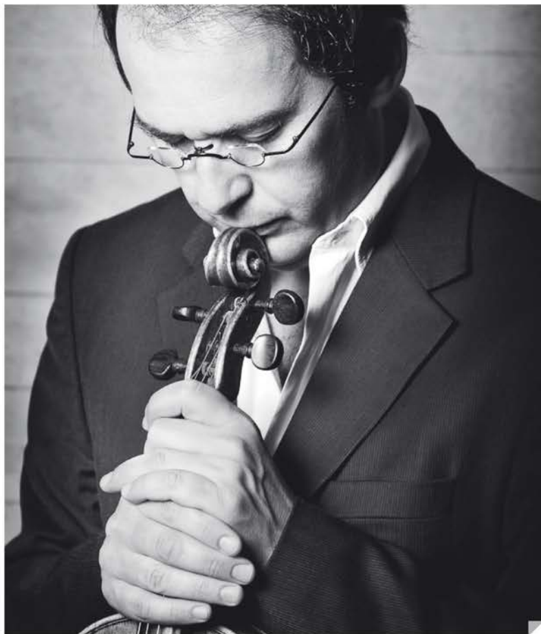
Miguel Da Silva ©DR