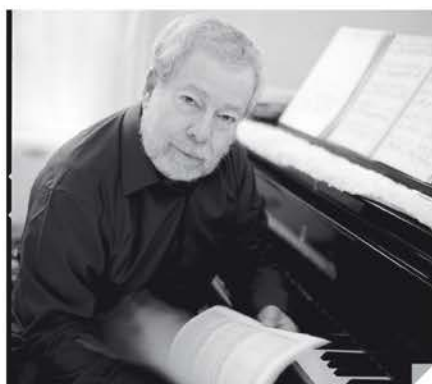
Nelson Freire