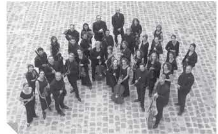
Concert Spirituel

Ouverture du Festival avec l'un des plus prestigieux orchestres baroques français, spécialiste de ce répertoire de la musique sacrée de Vivaldi et de Campra, dans l'écrin que constitue l'Abbatale.